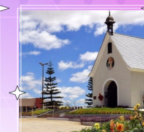
SANTUÁRIO MÃE RAINHA