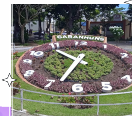
RELÓGIO DE FLORES